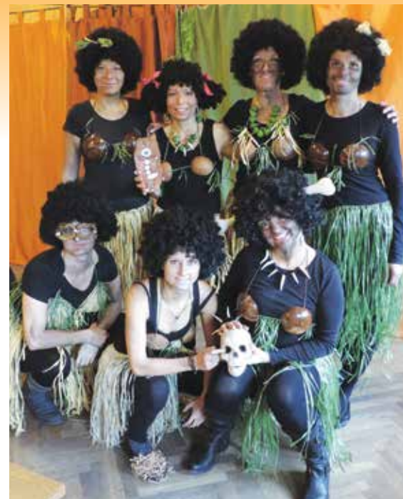
Dolnojirčanské hasičky zahrály netradiční pohádku pro děti v hostinci na Kopečku

a my jimi zálohujeme i profesionální kolegy z HZS.