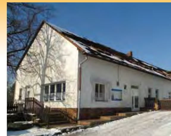
Současné foto statku č. p. 13, ve kterém nyní sídlí základní škola

Domek je již zbořený, a tak zůstaly jen vzpomínky pamětníků a staré fotografie.