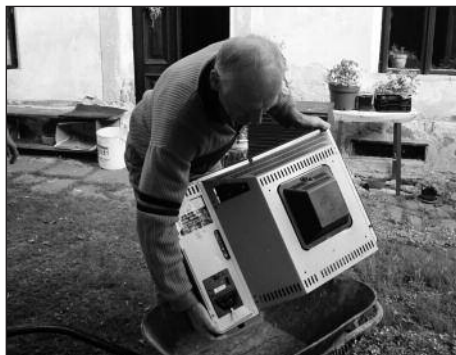
I takto lze odvážet televizor

Zpětný odběr a recyklace jedné televize uspoří tolik energie, kolik spotřebuje žárovka za čtyři měsíce nepřetržitého svícení, spotřebu ropy osobního automobilu za 22 km jízdy nebo zabrání vzniku odpadní vody z deseti sprchování. Tato zjištění přinesla analýza dopadu sběru a recyklace televizí a monitorů na životní prostředí, jejíž vytvoření iniciovala nezisková společnost ASEKOL. Výsledek studie, která je celosvětově unikátní, jednoznačně prokázal, že zpětný odběr elektrozařízení je pro životní prostředí přínosný.