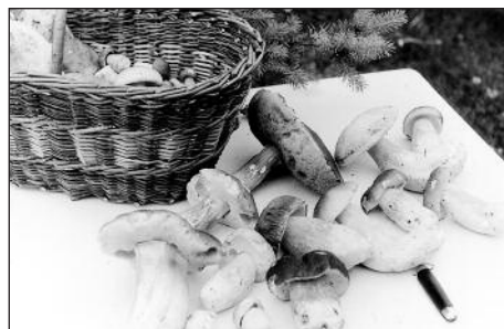
...a letos rostou