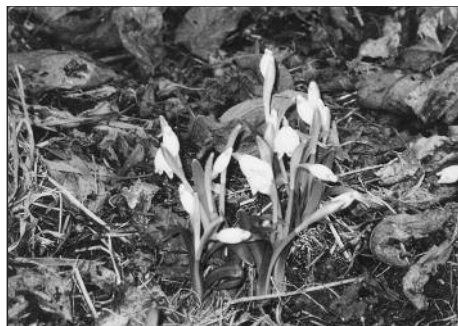
Na jaře poslal foto Petr Sivaninec ml., který rád a často fotí zdější přírodu.

U vstupu do stravovacího zařízení společného stravování provozovaného na základě hostinské činnosti je jeho provozovatel povinen viditelně označit (tedy před vstupem do zařízení), zda jde o: a) nekuřácké zařízení – musí být označeno grafickou značkou Kouření zakázáno, b) kuřácké zařízení – musí být označeno grafickou značkou Kouření povoleno, c) zařízení s vyhrazenými prostory – to musí být označeno grafickou značkou Stavebně oddělené prostory pro kuřáky a nekuřáky (každý prostor je nutný označit zvlášť). Tato povinnost neplatí pro zahrádky.