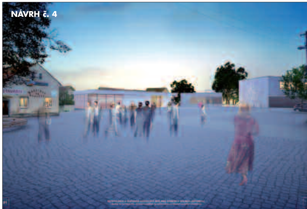
Architectural rendering of a public square at dusk, showing people walking and buildings in the background.