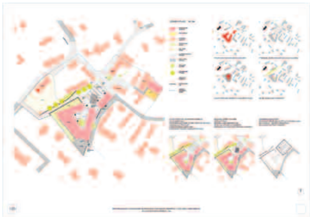
Architectural site plan and diagrams, including a legend and various views of the site.