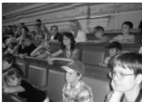
Zasedání poslanců v Parlamentu ČR zažil ve skutečnosti málokdo