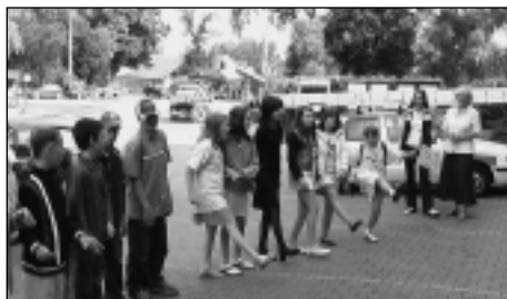
Pátáci zazpívali anglickou písničku ze svého úspěšného vystoupení na Sluníčkové slavnosti

Přejeme všem našim školáčkům, aby se jim v novém školním roce dařilo a aby opět v rodinném kruhu vymysleli ty nejnápaditější výrobky do Sluníčkových rodinných soutěží. Už se moc těšíme!