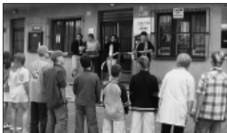
Jak se starostka obce loučila se žáky 5. třídy

roku už se chystají různé zajímavosti a projekty. Jeden z nich přijde hned v září. I naši noví prvňáčkové, na které se moc těšíme, budou mít možnost se zapojit do krásného projektu nazvaného „A když se řekne Václav...“ Jistě Vás také napadlo hned několik osobností nebo zážitků spojených s tímto jménem. A na to, co napadne všechno nás, se budete moci podívat 24. 9. 2007. Pozorně sledujte webové stránky a informační místa naší školy!