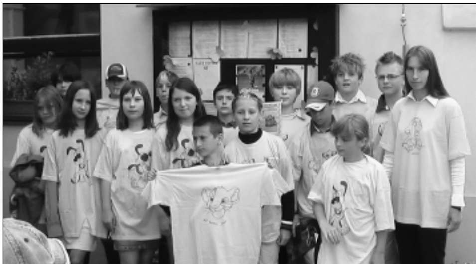
Poslední zvonění žáků 5. třídy ve školním roce 2006/2007

Ve škole však o prázdninách není prázdno. Na půdě jsme našli připravený slavnostní hodo-kvas, asi se náš skřítek už těšil, že bude mít klid, ale kdepak. Na prahu nového školního