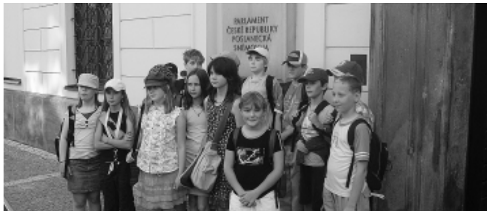
Velkým zážitkem pro pátáky byl projektový den, v rámci kterého navštívily děti Parlament ČR, prohlédly si pražské památky a popovídaly si anglicky s cizinci na Karlově mostě