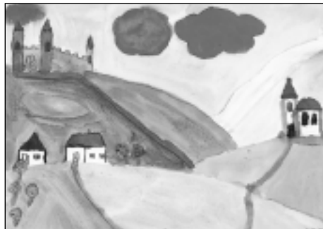
„Cesta na hrad“ – Jiřinka

Nyní máme pro vás hádanky, abyste si muse-li lámat hlavinky! Tak jdeme na to! Řešení najdete na straně 31.