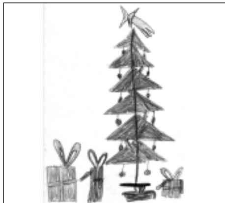
„Vánoce“ – Davídek

Od nejmenších dětí docházejí obrázky, které budeme postupně otiskovat. Všem děkujeme.