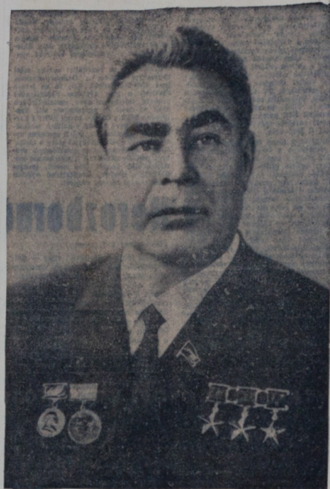
Leonid Iljič Brežněv generální tajemník Ústředního výboru KSSS a předseda prezidia Nejvyššího sovětu ČSSR.

30.5.1978. Na pozvání, ústředního výboru KSC předseda ČČR a Gustava přátelskou návštěvou Československé socialistické republiky Leonidem Iljičem Brežněvem, v v. Šterbichově ze v. Pouchovem,